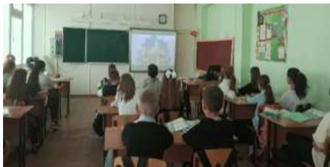
Акция «Я – россиянин»