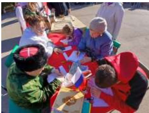
Акция «Письмо солдату»

4 ноября Россия празднует День народного единства. МОУ СОШ №4 приняла активное участие в акциях, посвященных данному празднику.